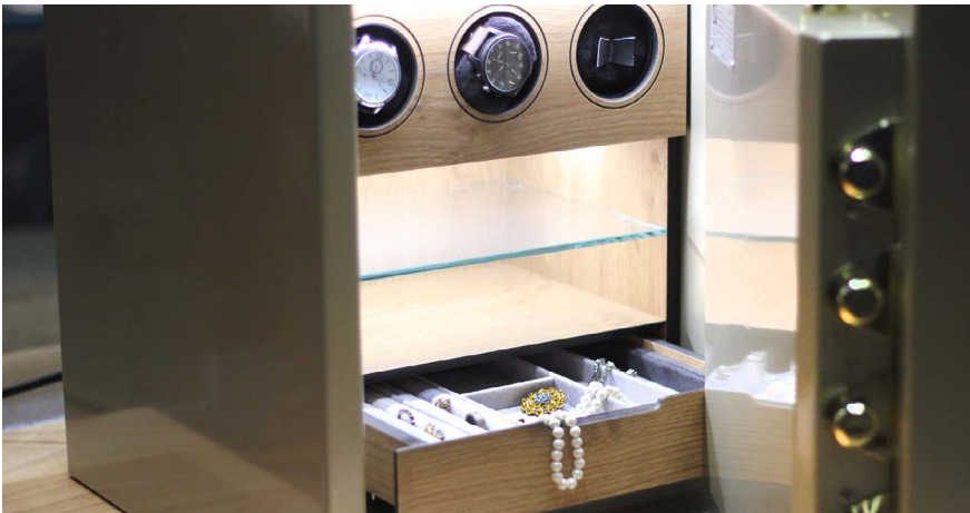
Präzisere Vorgaben, zum Beispiel was die Aufbewahrung von Wertsachen und Bargeld betrifft.

und Bargeld präziser fest. Neu ist explizit auf die anfallenden Gebühren zu achten. Weiter werden die zulässigen Anlagemöglichkeiten entsprechend den unterschiedlichen Bedürfnissen erweitert. Für die mit der Vermögensverwaltung beauftragten Personen und die Betroffenen selber werden die Regelungen besser nachvollziehbar und die Handhabung wird einfacher. ■